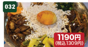
チキンカジャセット CHICKEN KHAJA SET